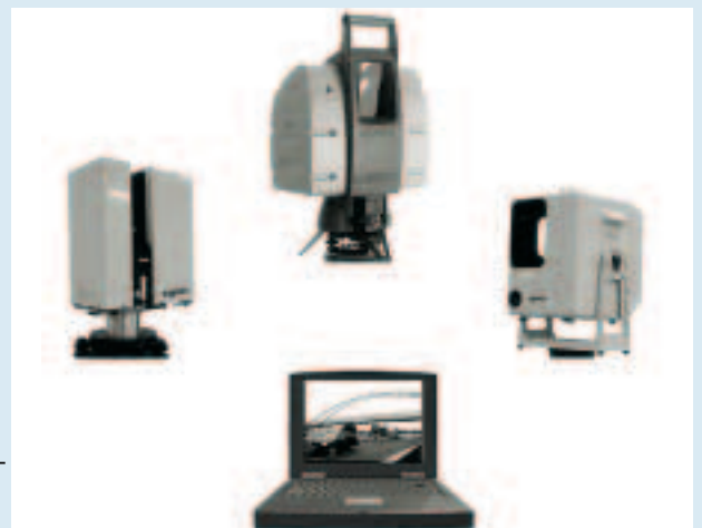
Die HDS-Familie von links nach rechts im Uhrzeigersinn: Der superschnelle HDS4000, der ganz neue HDS3000, der weltweite Bestseller HDS2500 sowie die Software Cyclone und CloudWorx.

Leica Geosystems prägt die Laserscanner-Technologie erneut und gibt ihr einen neuen Namen: High-Definition Surveying, kurz HDS™ (hochdefinierende Vermessung). Weshalb? Erstens, weil „hochdefinierend“ ihre herausragende Eigenschaft besser beschreibt: hochverdichteter Daten- und Bildreichtum im Vergleich zur Punkt-zu-Punkt-Vermessung. Zweitens macht Leica Geosystems mit HDS deutlich, dass diese neue Familie von Hard- und Software-Produkten für das Vermessungswesen und die Ingenieurvermessung nun vollumfänglich fit und anwenderfreundlich ist. Der Leica HDS 3000 sieht nicht nur wie ein Vermessungsgerät aus und ist so zu bedienen, sondern man kann ihn direkt georeferenziert zu lokalen oder anderen Koordinaten über einem Vermessungspunkt positionieren. Andere Vermessungserleichterungen sind seine Dreifuss-Zwangszentrierung, Horizontierung, einfacher Batteriewechsel und verbesserte Transportmöglichkeiten bei verringertem Gewicht. Ebenfalls nicht zu übersehen: die Vorteile der Software Cyclone™ und CloudWorx™ für die direkte und schnelle Erstellung von Vermessungs-Endprodukten. Einfacher als jemals zuvor. Herzlich willkommen in der HDS-Welt!