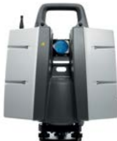
Scanner Laser HDS