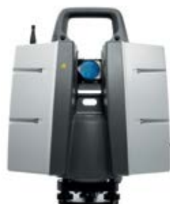
Laser Scanner HDS